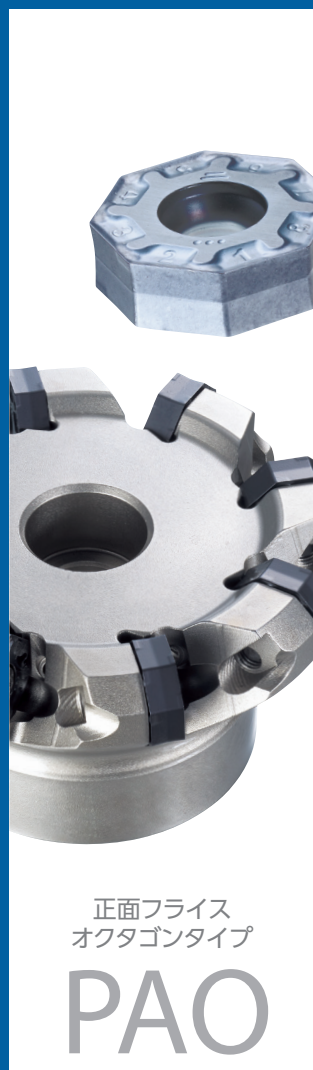
正面フライス オクタゴンタイプ