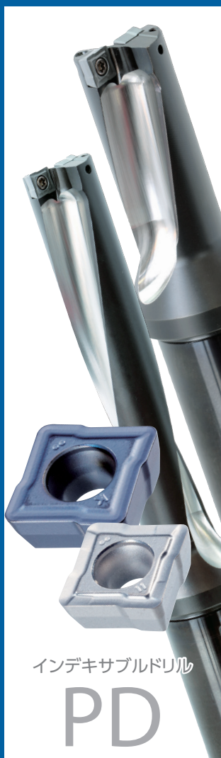
インデキサブルドリル