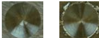
DLE(左)と従来品(右)でのバリ比較

DLEは切れ味と耐欠損性を両立した刃先形状により、安定加工とバリ高さの抑制を実現します。